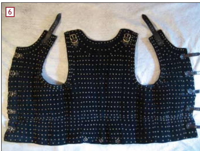
[6] Visione finale della brigantina lato esterno