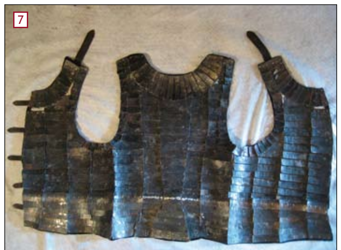
[7] Visione finale della brigantina lato interno